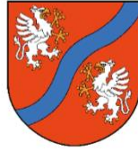
GMINA MSZANA DOLNA